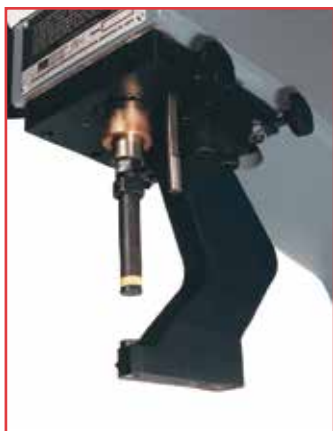
"Top Mount Reverse Flange Anvil Holder" inkluderar stans och dyna.

Valfri hållare och verktyg kan enkelt installeras på alla nya och befintliga PEMSERTER® Series 4®-pressar.