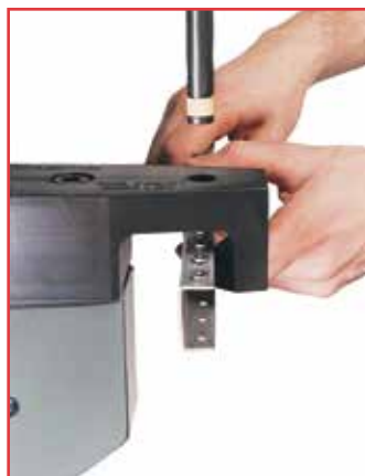
"Bottom Mount Reverse Flange Anvil Holder"