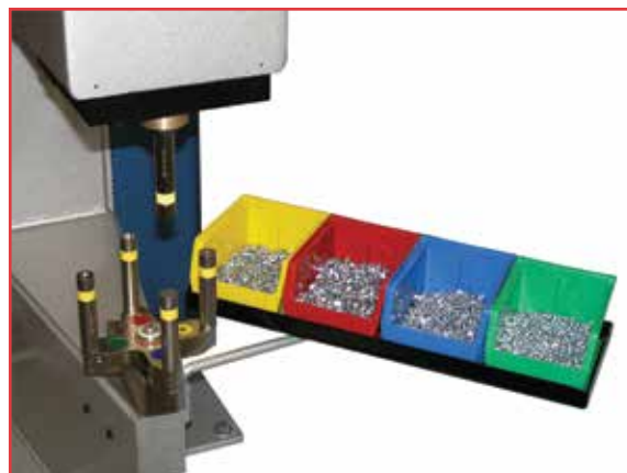
PEMSERTER® QX4™ manuellt verktygssystem ger en effektiv metod för att snabbt växla mellan fyra olika underverktyg. Den enhandiga funktionen av detta verktyg gör det möjligt för en operatör att montera fyra olika typer och / eller storlekar av fästelement med en set-up (beroende på fästelement).

När en detalj och fästelement ej kan monteras med hjälp utav standardverktyg, löser ofta "Reverse Flange Anvil Holder" problemet.